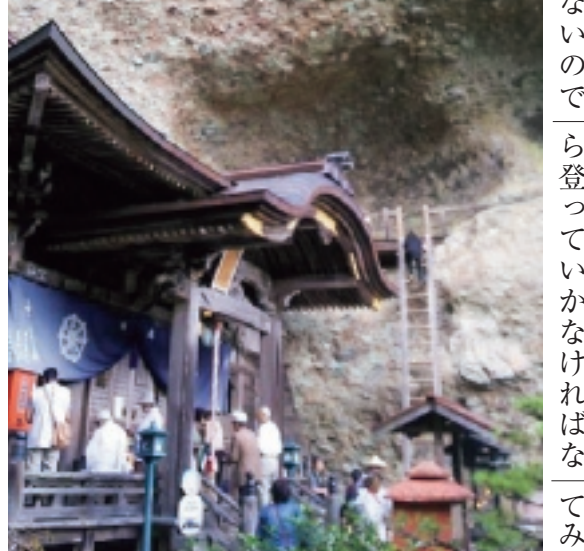
▲四国八十八ヶ所第四十五番札所 海岸山 岩屋寺

お遍路ゆかが行く! 知ってますか? 沖新田八十八ヶ所。沖新田八十八ヶ所第四十五番札所は、岡山市東区升田の四十四番札所を児島湾側に下りて直ぐ、同じ道沿いの用水側にあります。普段車が駐車し