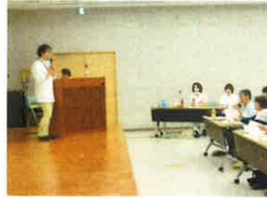
お薬との上手な付き合い方の話

5月19日 旭川荘研修センターよしい川にて、第15回生活習慣病講座『がんの話と健診の大切さ』が開催されました。西野所長と虹いろ薬局難波店長のお話があり、68名の参加でした。質疑応答も活発！健康、健診に関心の高さを実感しました。