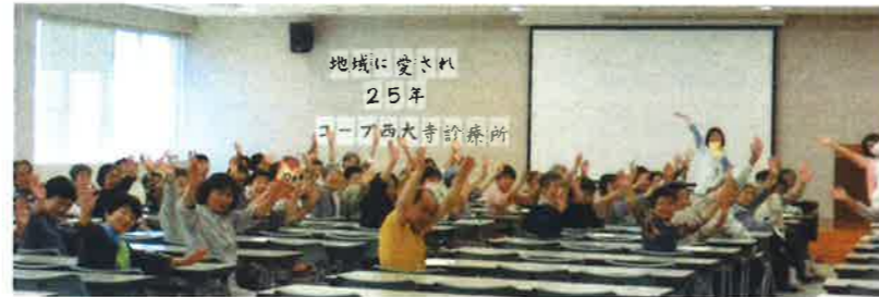
参加者のみなさんと一緒に！