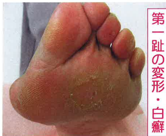
第一趾の変形・白癬