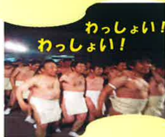
わっしょい！ わっしょい！

本人のブログに「境内の上ではスターのよう。そんな気分も一転。裸の男たちの雄叫びが。（こりとり場より）そして宝木争奮に加わる決意を・・・」と載せられていました。