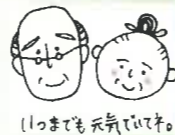
いっまでも元気です。