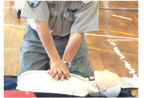
AEDの使い方をしっかり教えてもらいました。(写真は記事とは別のものです)