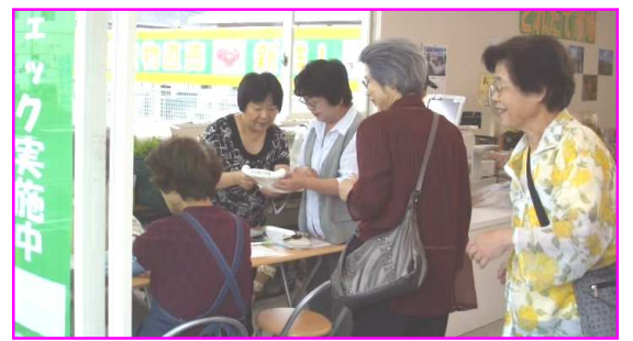
「体脂肪がネ... 握力はあるのよ」

六月十五日、古都支部と竜ノ口支部は結成してから初めての「健康チェック」をとれた市場で行ないました。生憎の雨でしたが、お店の方が店内の一部を貸して下さり、十三人が血圧などの検査をされました。初めての方に「体脂肪がネ...」