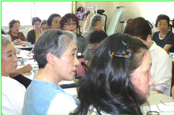
各支部の活動報告に聴き入る参加者の皆さん

6月8日みんなの診療所2階にて十四年目のはなみずきの総会を行いました。梅雨の蒸し暑い時、主婦にとってホットの間ですが、五十九名という多くの人々が集まってくれました。話あり、笑いあり、弁